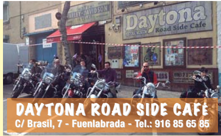
DAYTONA ROAD SIDE CAFE C/ Brasil, 7 - Fuenlabrada - Tel.: 916 85 65 85

En la localidad madrileña de Fuenlabrada puedes disfrutar del ambiente más motero, con especial atención al mundo del custom, en el espectacular bar Daytona.