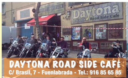
DAYTONA ROAD SIDE CAFÉ C/ Brasil, 7 - Fuenlabrada - Tel.: 916 85 65 85

En la localidad madrileña de Fuenlabrada puedes disfrutar del ambiente más motero, con especial atención al mundo del custom, en el espectacular bar Daytona.