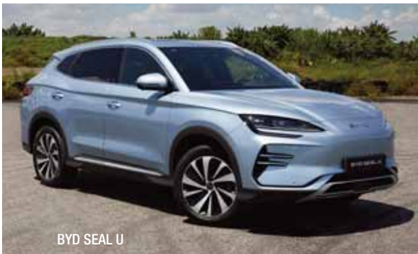
BYD SEAL U