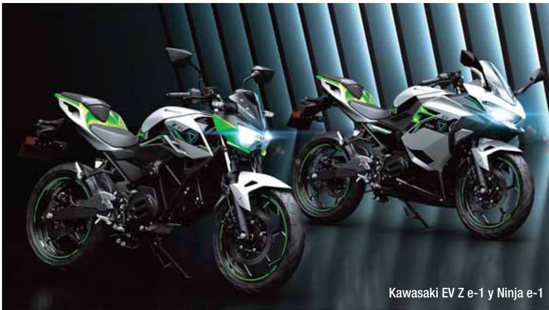
Kawasaki EV Z e-1 y Ninja e-1

Para saber todo sobre las nuevas Ninja-e1 y Z-e1 tenéis toda la información en este enlace a nuestra web: LAS NUEVAS MOTOS ELÉCTRICAS DE KAWASAKI .