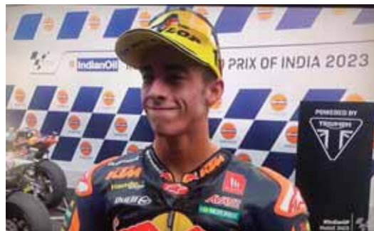
PEDRO ACOSTA sigue sin dar tregua en Moto2 y consiguió un triunfo más para sumar un total de seis victorias y 10 podios.