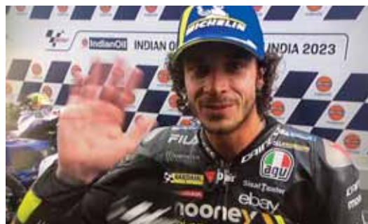
MARCO BEZZECCHI dominó durante el fin de semana y lo reflejó en la pista con el triunfo en la carrera de MotoGP del domingo en India.