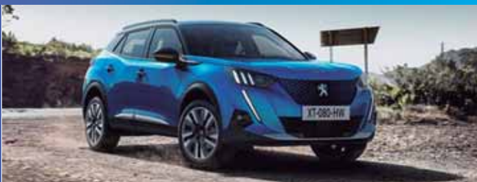
El Peugeot 2008 es el modelo que más matriculaciones en renting acumula.

En cuanto a marcas, las cinco primeras posiciones en matriculaciones las ocupan Peugeot, Volkswagen, Seat, BMW y Toyota.