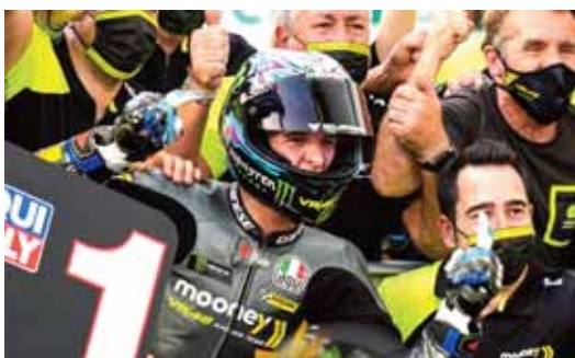
MOTO2 Celestino Vietti no dio opciones a sus rivales y consiguió su primera victoria en Moto2 a seis segundos del segundo clasificado.