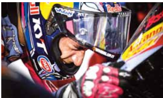
MOTOGP El italiano Enea Bastianini empezó la temporada ganando por primera vez en la máxima categoría del Mundial.